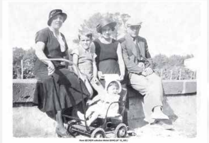
Les premiers rayons de soleil c'est l'occasion d'aller en famille profiter de la douceur printanière sur les allées général Roques.... mais ce n'est pas une raison suffisante pour abandonner veston et cravate, tout juste la casquette apporte-t-elle une petite note plus décontractée...