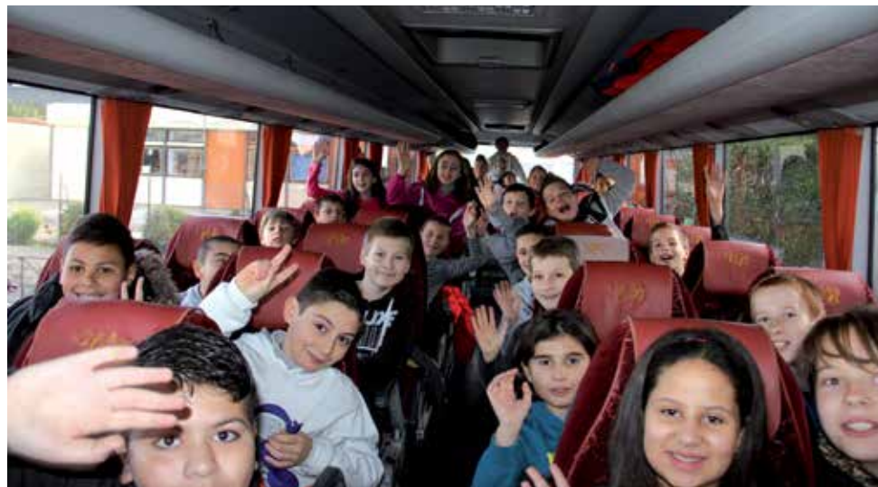
Départ des élèves pour la station de Bolquère, située au cœur du Parc Naturel Régional des Pyrénées Catalanes, perchée entre 1600 et 1800 m d'altitude sur le haut plateau Cerdan

Des sacs, des valises et une cinquantaine d'enfants bien emmitoufflés dans leurs anoraks envahissaient le parking de l'école Maffre de Baugé en ce premier jour du mois de mars. Ils étaient fin prêts à partir