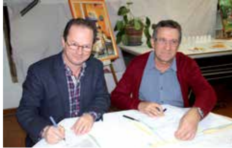
Le maire et le président de la MJC ont signé la convention

Volet C , « Ecole de musique », il s'agit