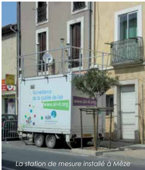
La station de mesure installée à Mèze

AIR LR, organisme agréé pour la mise en œuvre de la surveillance de la qualité de l'air et la diffusion de l'information dans la Région LR, a installé une station de mesure à proximité du trafic routier en centre-ville de la commune de Mèze (Hérault), le long de la route départementale RD613.