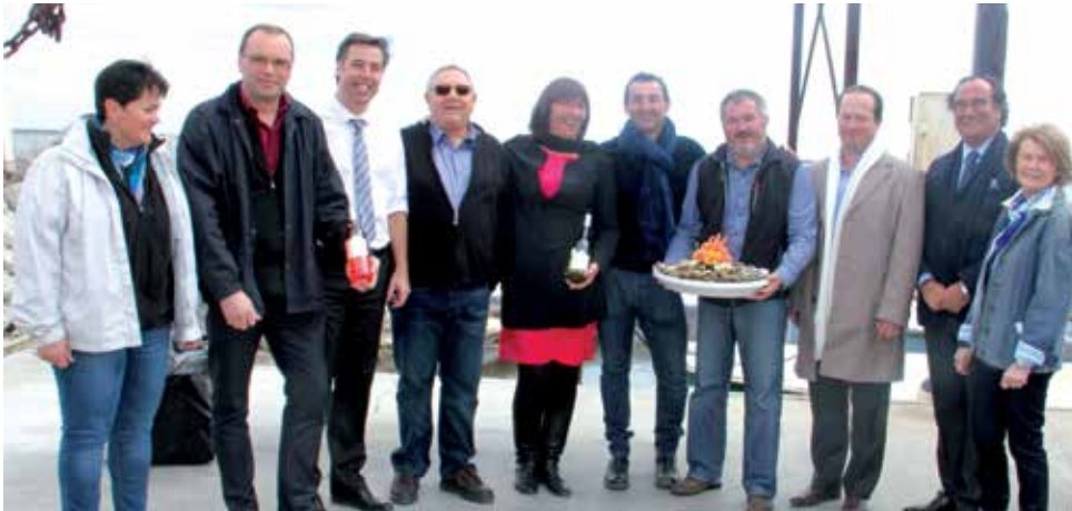
Elus et Médailleurs à l'unisson devant les produits primés