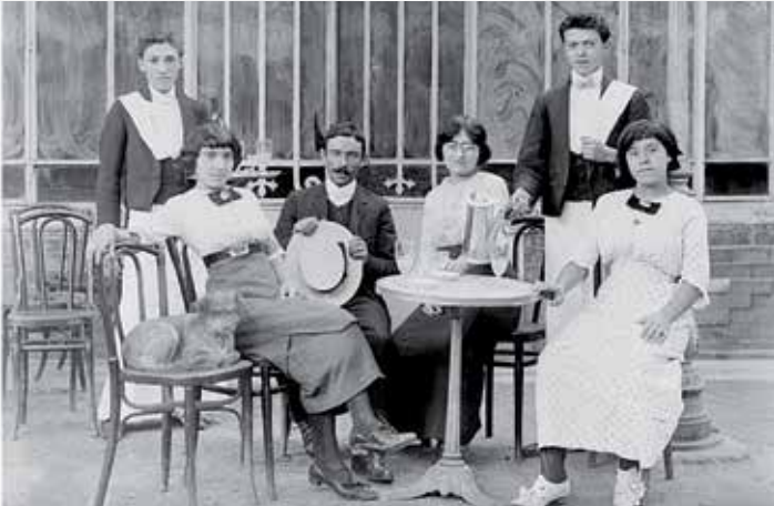
Dans les jardins du Grand café de la grille qui occupait jusqu'en 1919 le rez de chaussée de l'actuelle mairie on rivalisait d'élégance : deux garçons de café stylés et en grande tenue, des demoiselles très élégantes qui accompagnent (ou est-ce le contraire ?) un monsieur chapeauté ....jusqu'au chien confortablement installé sur sa chaise qui se prélassé au soleil !

A chaque numéro l'association « Marseillan d'Hier et d'Aujourd'hui » nous propose une rétrospective photos sur un thème différent.