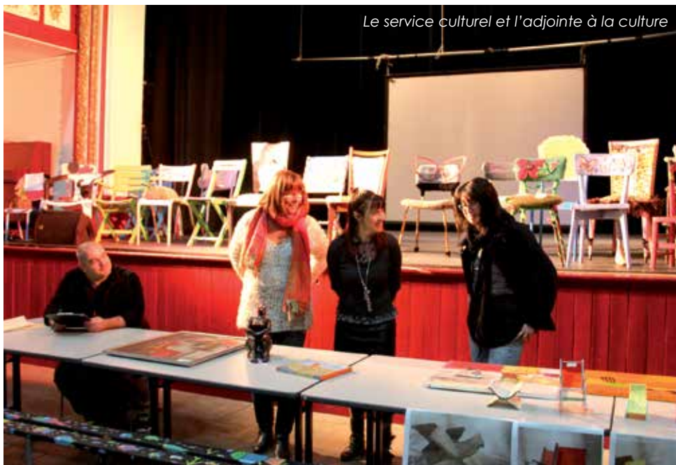
Le service culturel et l'adjointe à la culture

A la Médiathèque la Fabrique, cet événement fut également l'occasion de voyager à travers le patrimoine de la ville. L'association « Marseillan Patrimoine Environnement » a présenté sa brochure « Portes et Croix de Marseillan ». Un