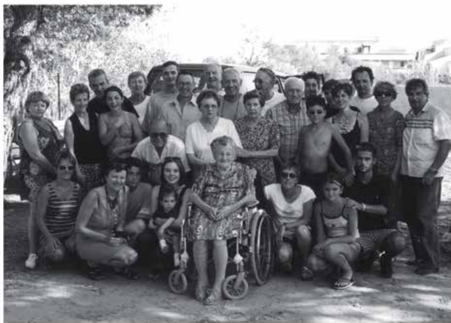
And BECKER Collection Louis Bontemps (N°131)

Texte de Albert Arnaud.