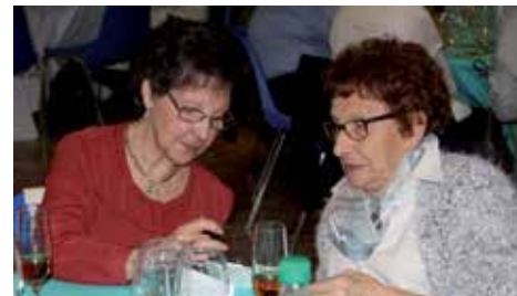
On reste connectées même à table !