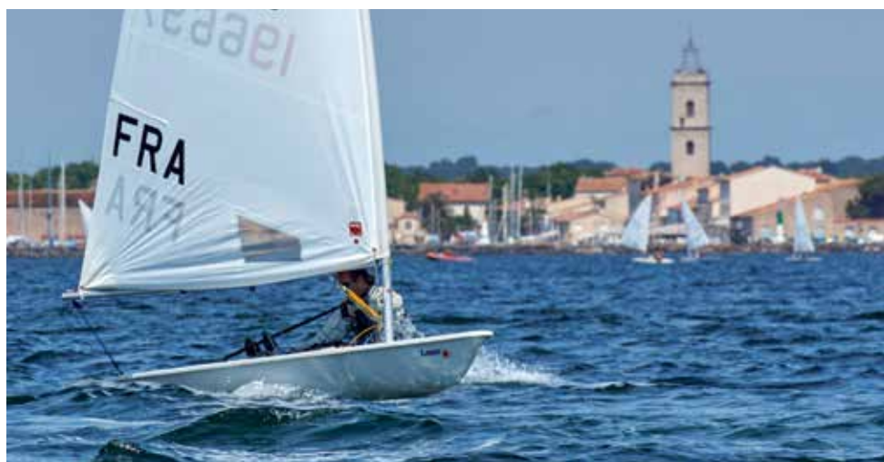
La lagune de Thau très prisée par les voileux

L'association nationale de classe Laser a confié au Cercle de Voile de Marseillan le soin d'organiser le National Sud de printemps Laser qui se tiendra du 5 au 8 Mai 2016. Ce championnat s'adresse à tous les pratiquants du sud de la France, à partir de 15 ans et sans limite d'âge. Ce seront donc 180 compétiteurs représentant l'élite de leur