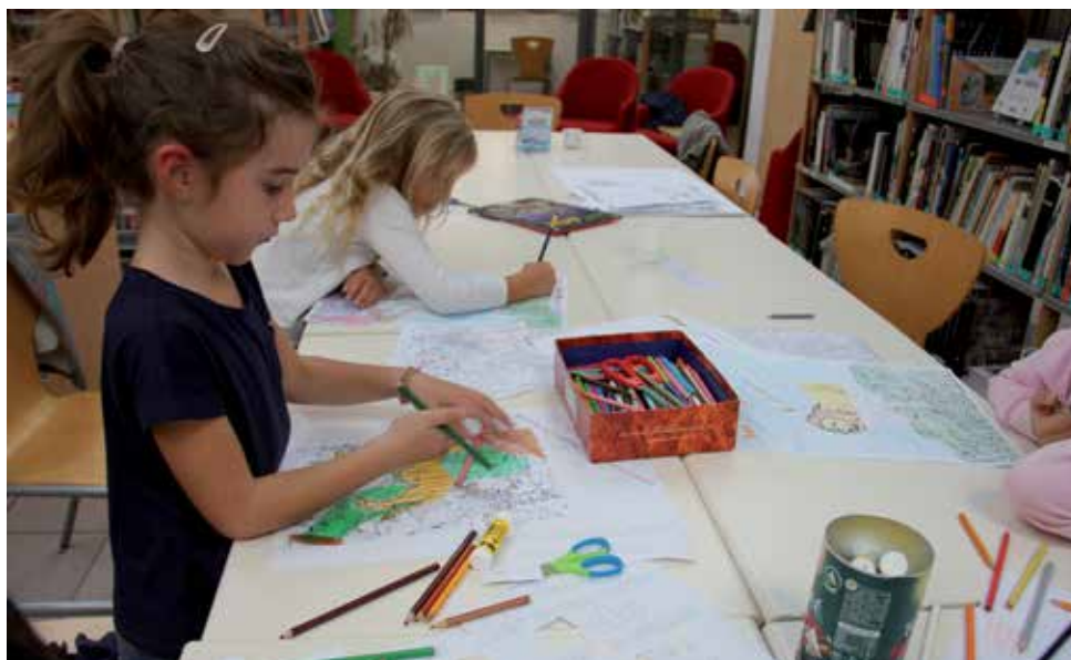
La médiathèque propose de nombreux ateliers créatifs pour les enfants