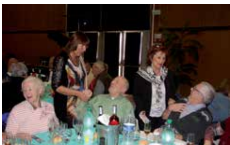
Un vrai moment de fête pour tous